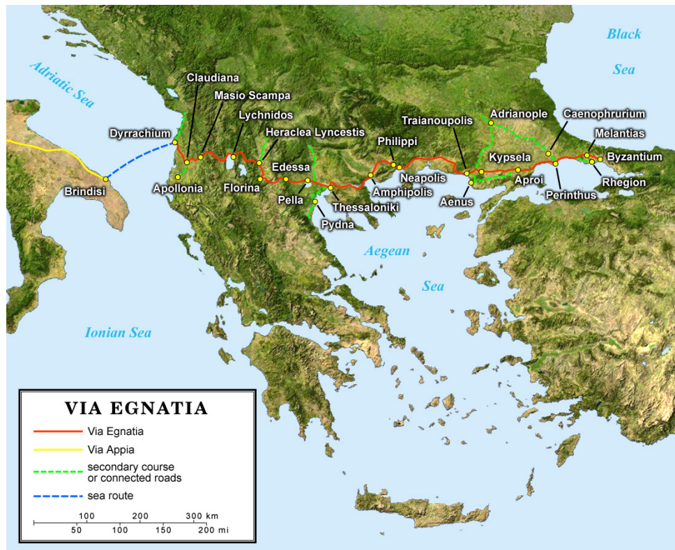
Abbildung 11: Die Trasse der via Egnatia