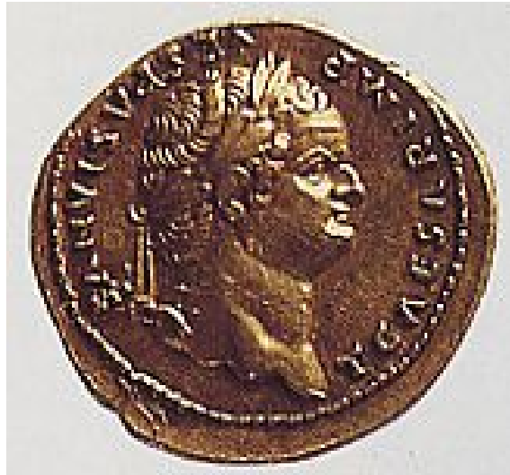
Abb. 1: Münzbild des Kaisers Titus 4

n. Chr. verbunden ist. Dieses Jahr ist für jüdische Geschichte von epochaler Bedeutung, weil das Erliegen des Tempelkults eine völlige Neuorientierung nach sich zieht. 3 Diese »Leistung« des Titus ist für uns daher wesentlich wichtiger als alles, was er während seiner kurzen Regierung getan hat.