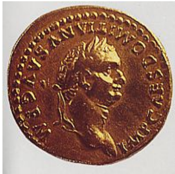
Abb. 4: Münzbild des Kaisers Domitian 20