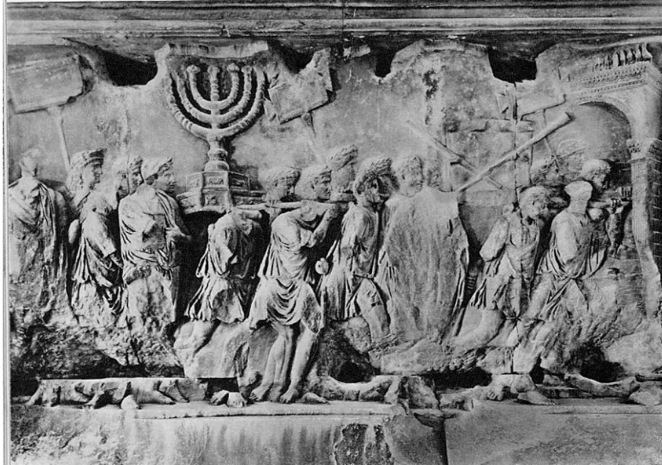
Abb. 3: Der Triumph über Judaea 11

Bereits im Juni 71 wurde der Triumph über die Juden in Rom gefeiert. Münzen zeigen das Motiv Judaea capta . 9 Das Kolosseum „wurde wohl aus der jüd.[ischen] Beute als Siegesmonument erbaut (CIL VI 40454a mit Komm.[entar]).“ 10