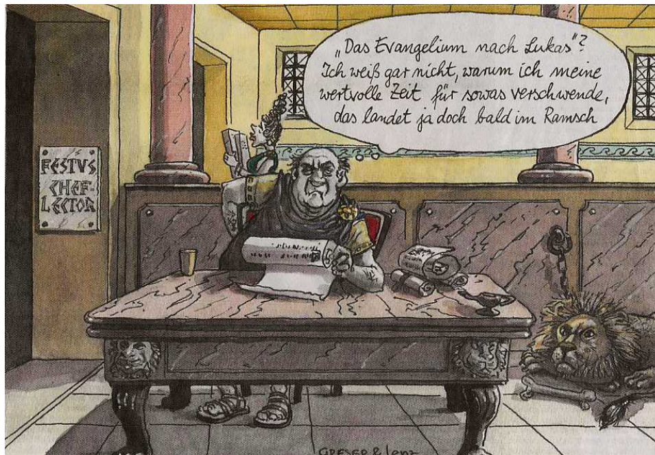
Abb. 6: Auch die Frankfurter Allgemeine Sonntagszeitung ... 36

Textzeugen erschien dies so unglaublich oder doch ungewöhnlich, daß sie sich zu der Ergänzung et spiritui sancto veranlaßt sahen. 37