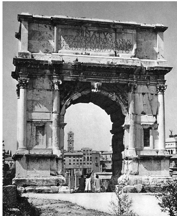
Abb. 2: Der Titusbogen in Rom 6

Am 1. Juli 69 wird sein Vater Vespasian zum Imperator proklamiert; Titus erhält den Namen Titus Caesar Vespasianus; nach seiner eigenen Akklamation zum Imperator heißt Titus dann Imperator Titus Caesar Vespasianus. Titus erhält selbst den Oberbefehl über die Tuppen in Iudaea 7 und erobert im September 70 Jerusalem, „wobei er angeblich die Zerstörung des Tempels ... zu verhindern suchte (Ios. bell. Iud. 6,236), was histor.[isch] ganz unwahrscheinlich ist.“ 8