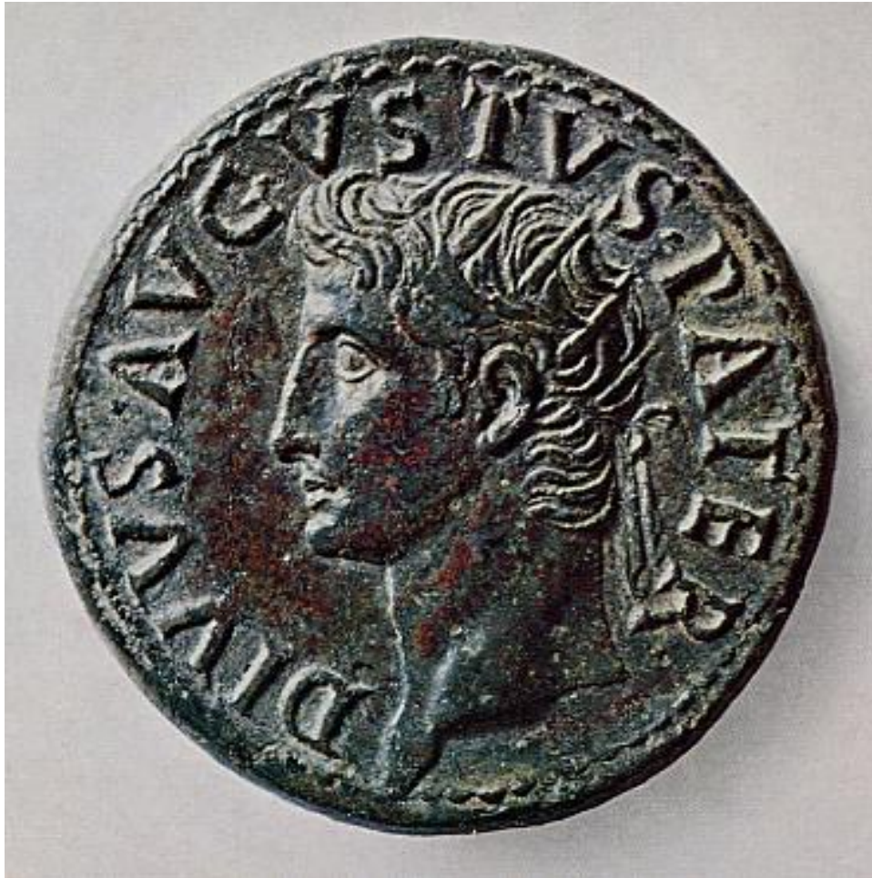
Abb. 1: Der Kaiser Augustus 15

ihre Stellung kennzeichnender Titel geworden, der den Rahmen um ihre eigenen Namen bildet.“ 16