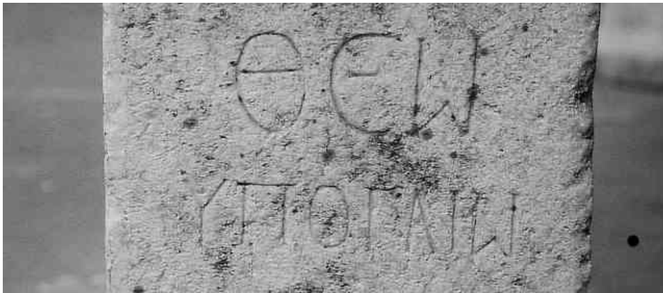
Abb. 1: Der unterirdische Gott in Philippi 46