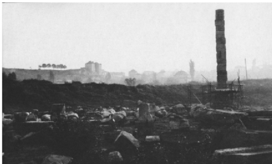
Abb. 1: Der Tempel der Artemis von Ephesos heute

In der Antike zählte dieser Tempel dagegen zu den sieben Weltwundern. Er wurde von allen Menschen bestaunt. Einen Eindruck davon können heute nur noch Rekonstruktionszeichnungen und Modelle vermitteln.