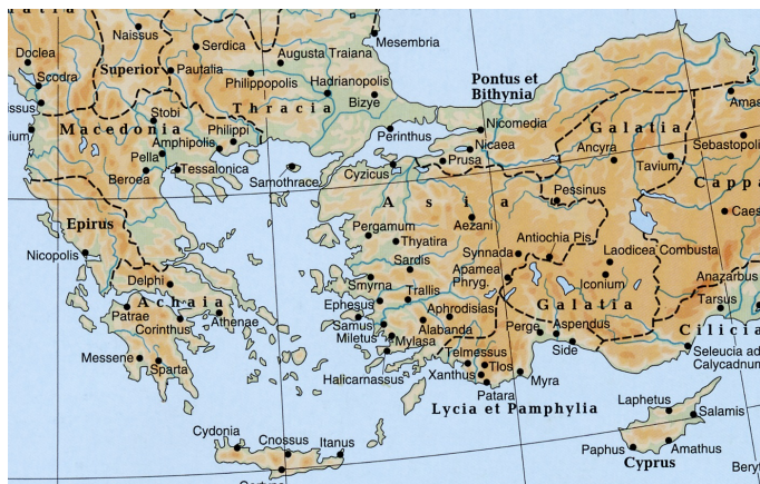
Abbildung 13: Der Weg nach Bithynien/Pontus

Sie sehen, wie detailliert die Begleitung ist, die der Kaiser seinem Statthalter angedeihen läßt. Man darf fragen, ob die Angestellten im kaiserlichen Büro, die für die Erledigung der Korrespondenz zuständig waren, sich nicht manchmal wunderten, wegen welcher Lappalien ihr Herr von seinem Statthalter in Bithynien und Pontus behelligt wurde. Brief Nr. 17a wäre dafür ein gutes Beispiel: „C. Plinius an Kaiser Trajan. Herr, wenn mir die Seereise bis Ephesos sehr gut bekommen ist, so habe ich, seit ich im Wagen reise, sehr unter der drückenden Hitze und auch an leichten Fieberanfällen gelitten und deshalb in Pergamum haltgemacht. Als ich dann auf Küstenschiffe übergestiegen war, wurde ich wieder durch Gegenwinde festgehalten und gelangte so wesentlich später als erwartet, das heißt: erst am 17. September nach Bithynien. Trotzdem brauche ich die Verzögerung nicht zu bedauern, denn ich durfte – ein sehr gutes Omen! – Deinen Geburtstag bereits in der Provinz feiern. Zur Zeit prüfe ich die Ausgaben, Einnahmen und Außenstände in Prusa, was, wie ich im Verlauf meiner Tätigkeit mehr und mehr merke, unbedingt notwendig ist. Viele Gelder werden nämlich aus den verschiedensten Gründen von Privatleuten festgehalten, manches außerdem für ganz ungesetzliche Zwecke aufgewendet. Dies schreibe ich Dir, Herr, unmittelbar nach meinem Eintreffen.“ 12