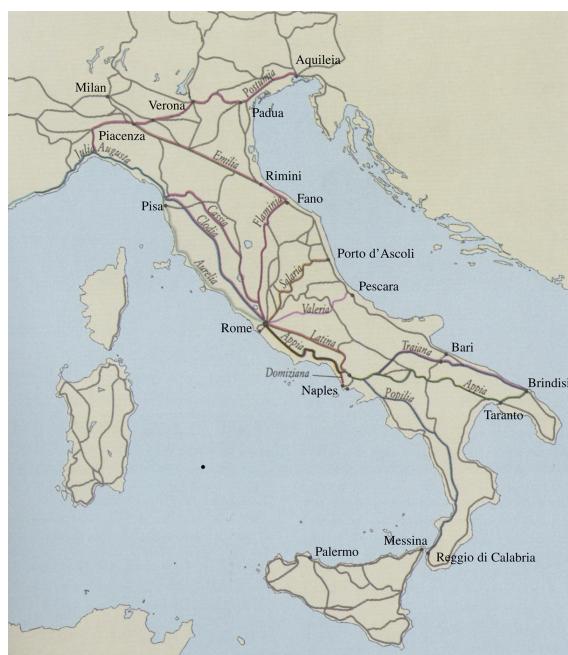
Abb. 2: Die via Appia von Brindisi nach Rom 7

Den ersten Abschnitt der Kampagne kennen wir nicht. Erst in Philadelphia 6 stoßen wir auf den Bischof von Antiochien; von Philadelphia bis Philippi können wir praktisch jeden seiner Schritte verfolgen. Der Rest des Weges ist durch die Trassen der Überlandstraßen festgelegt: Von Philippi reiste Ignatius weiter nach