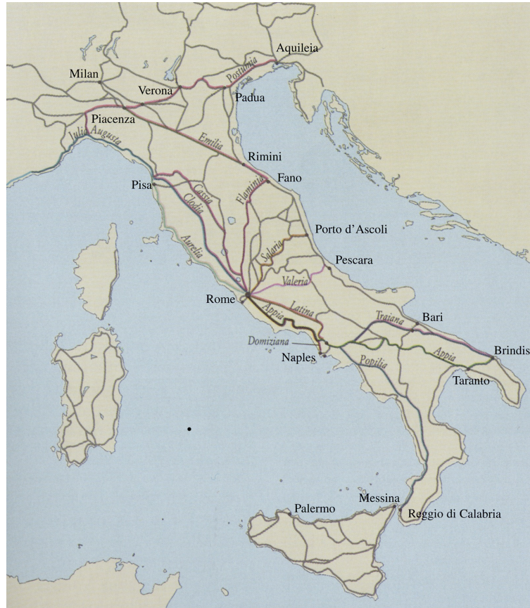
Abbildung 8: Die via Appia von Brindisi nach Rom

genen Reisen her schon wohlvertraut. Mit dem Schiff wurde die Adria überquert, und von Brundisium ging es dann wieder zu Fuß weiter auf der Via Appia nach Rom. Dort erlitt Ignatius im Circus Maximus das Martyrium.