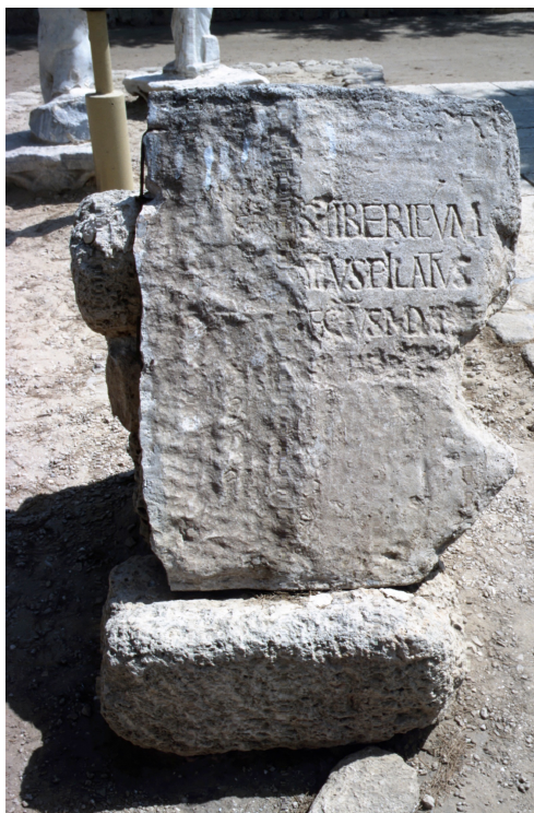
Abbildung 12: Die Pilatusinschrift aus Caesarea Maritima

[---]s Tiberieum [- Po]ntius Pilatus [prae]flectus Iuda[ea] [...]