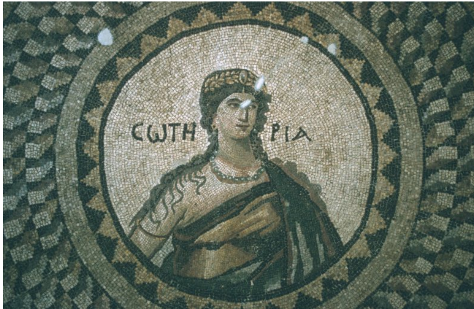
Abbildung 14: Ein Mosaik aus Antiochien

modern überbaut ist. So sind noch nicht viele Gebäude ergraben worden, und über die Straßen der Stadt kann man sich kein genaues Bild machen. Spektakulär sind die Funde von wundervollen Mosaiken, vgl. beispielsweise die Abbildung 14 oben auf dieser Seite (dieses Mosaik ist auch von theologischem Interesse, stellt es doch die σωτηρία [ sōtēria ] dar, die »Erlösung«). Das Museum in Antakya ist schon wegen dieser Mosaiken einen Besuch wert.