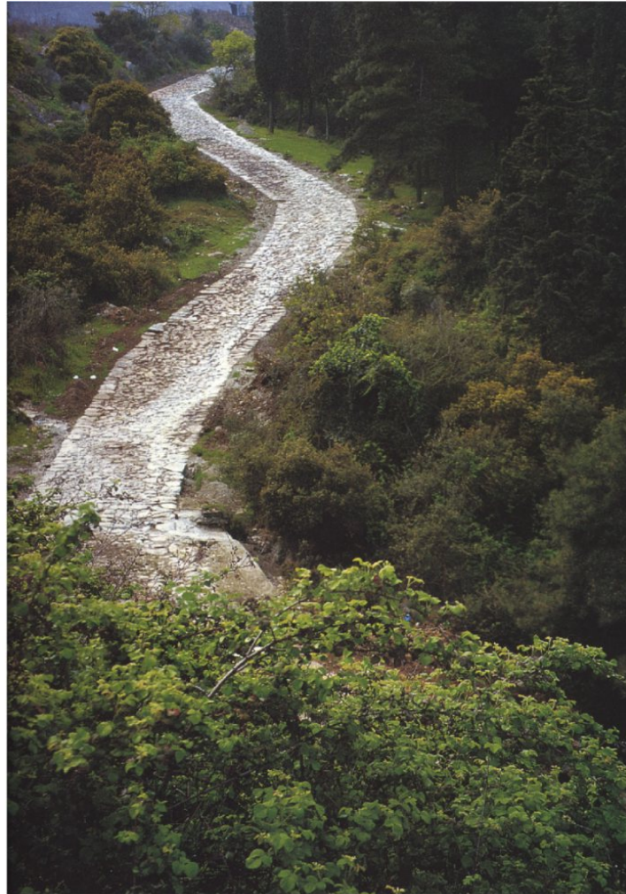
Abbildung 23: Die via Egnatia nach Philippi

Ich schrieb einerseits eine Monographie 26 , andererseits eine Sammlung der Inschriften 27 . Diese können Sie jetzt auch im Netz unter http://www.philippoi.de bewundern. Die zweite Auflage der Inschriftensammlung ist im Jahr 2009 in erweiterter Fassung erschienen. 28