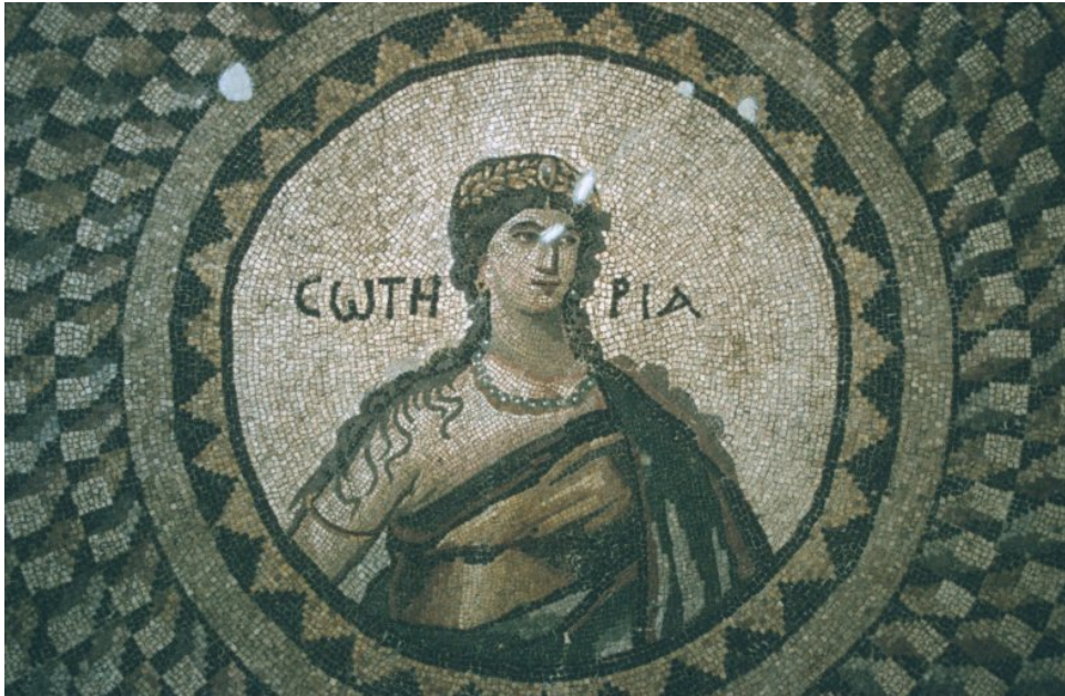
Abbildung 9: Ein Mosaik aus Antiochien

von theologischem Interesse, stellt es doch die σωτηρία [ sōtēria ] dar, die »Erlösung«. Das Museum in Antakya ist schon wegen dieser Mosaiken einen Besuch wert.