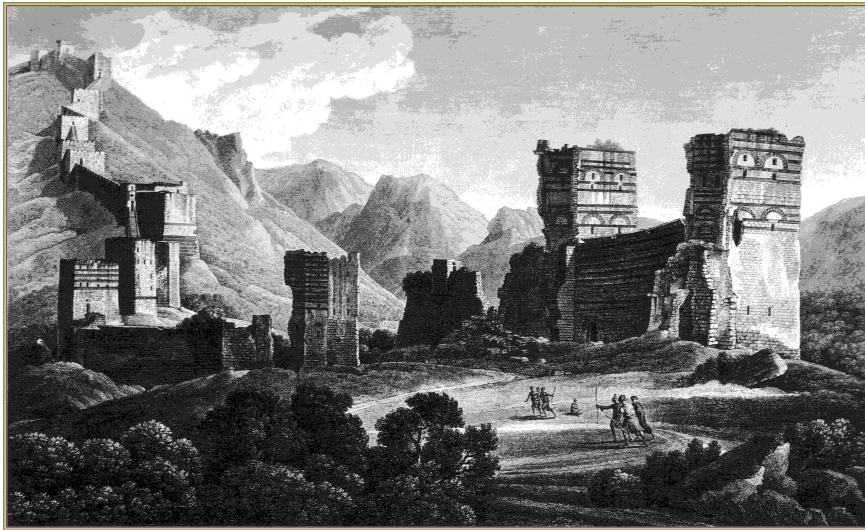
Abbildung 8: Alte Ansicht von Antiochien

sche Gemeinde gab – wohl gegen ca. 50000 Personen in römischer Zeit, dazu eine stärkere Gruppe Gottesfürchtiger (Josephus, bellum 7,46) – und guter Kontakt mit Jerusalem bestand.“ 13