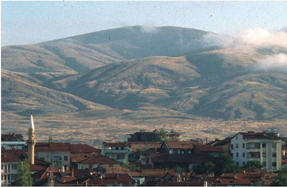
Abbildung 11: Das pisidische Antiochien

griechische Städte, aber keine römischen Kolonien. Antiochen ist daher für ihn etwas qualitativ Neues, etwas kategorial Anderes als alles, was er bisher kennt.