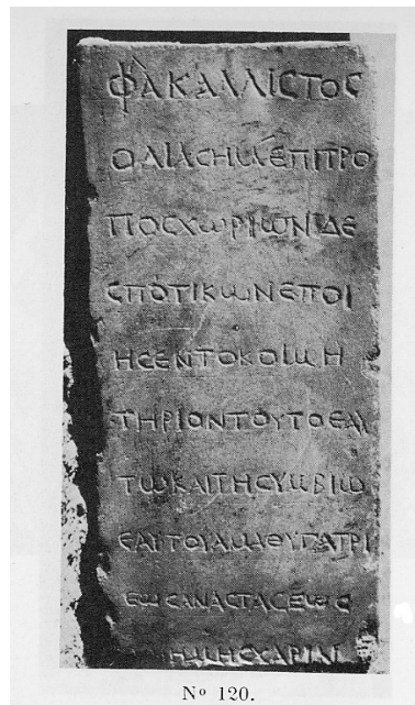
Abb. 1: Erste Grabinschrift aus Thessaloniki 42