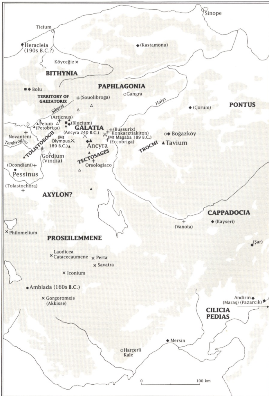
Abb. 3: Die Kelten in Asia Minor: Der Osten 15