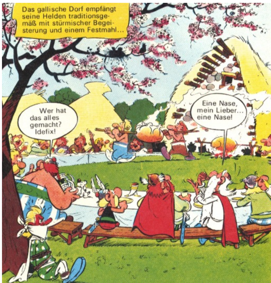
Abb. 4: Das Festmahl der Gallier 28

Neben diesen organisatorischen Eigentümlichkeiten fällt vor allem ein sozialer Zug auf, der auf die keltische Vergangenheit zurückweist. In der oben Anm. 25 genannten Inschrift, die die Priesternamen auflistet, ist dem jeweiligen Namen immer auch eine Angabe darüber beigefügt, „in welcher Richtung sich ihr gemeinnützigster Sinn während ihres Jahresamtes betätigt hat. Weitaus am häufigsten sind unter den Spenden der Priester die Speisungen des ganzen Volkes (δημοθεινία) vertreten: sie werden unter den Leistungen stets an erster Stelle genannt und fehlen kein einziges Mal.“ 27 Schon W.M. Ramsay hat in seinem Kommentar zum Gala-